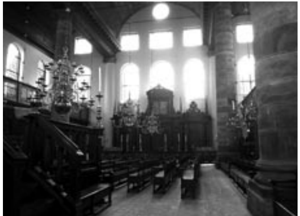
Portugiesische Synagoge Amsterdam

Wenige hundert Meter entfernt von der portugiesischen Synagoge befindet sich im Wertheim